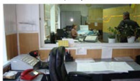
Пульт управління маневрами по станції Чернігів